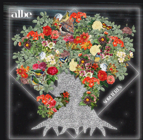
EP "Sorcières" Sortie le 20 septembre 2024