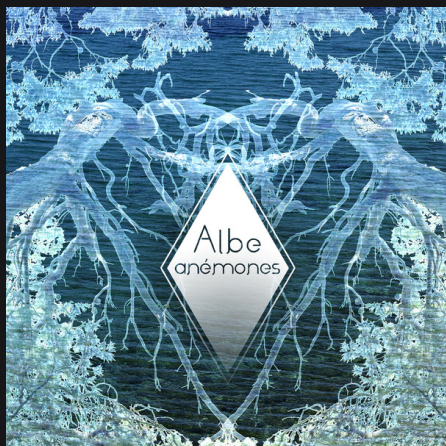
EP "Anémones" Sortie le 22 novembre 2020